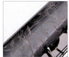
Shadowモデル オリジナル彫刻